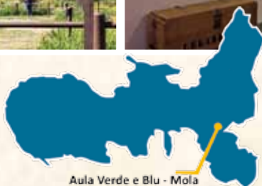
Aula Verde e Blu - Mola