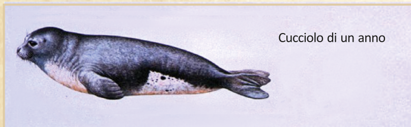
Cucciolo di un anno