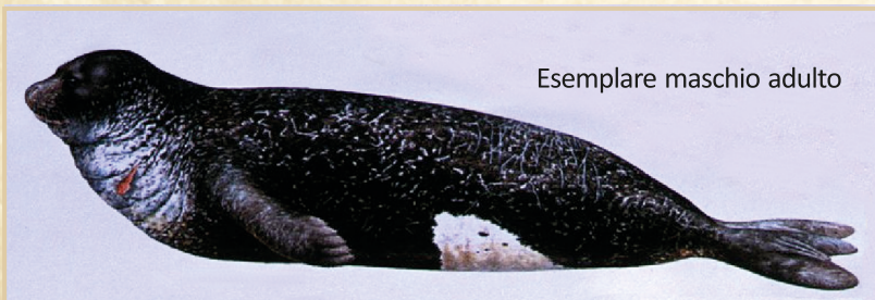
Esemplare maschio adulto