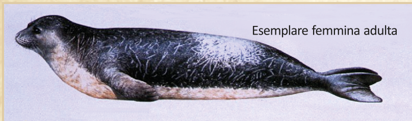
Esemplare femmina adulta