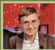
Giampiero Sammuri biologo, presidente del Parco Nazionale Arcipelago Toscano